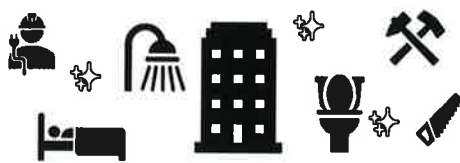
建物・建物付属設備の工事・修繕